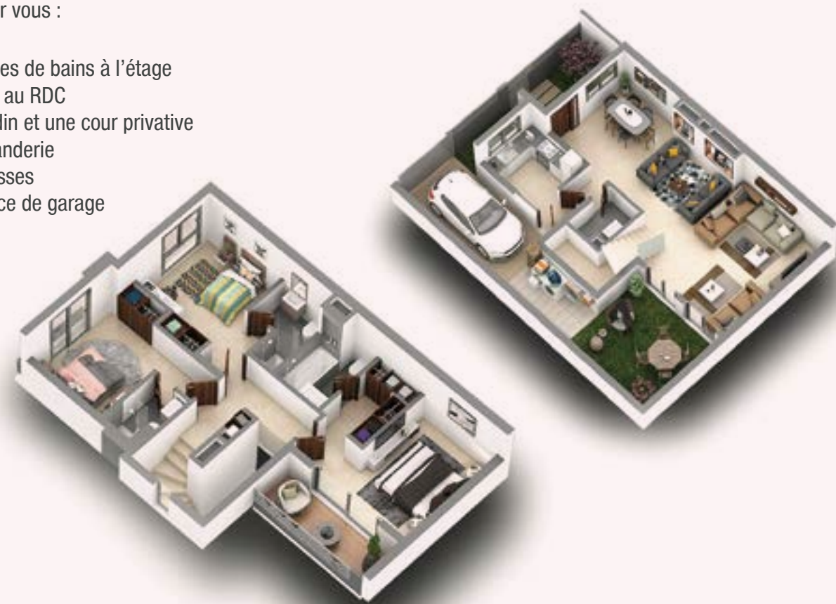
Villas 3 chambres / Salon