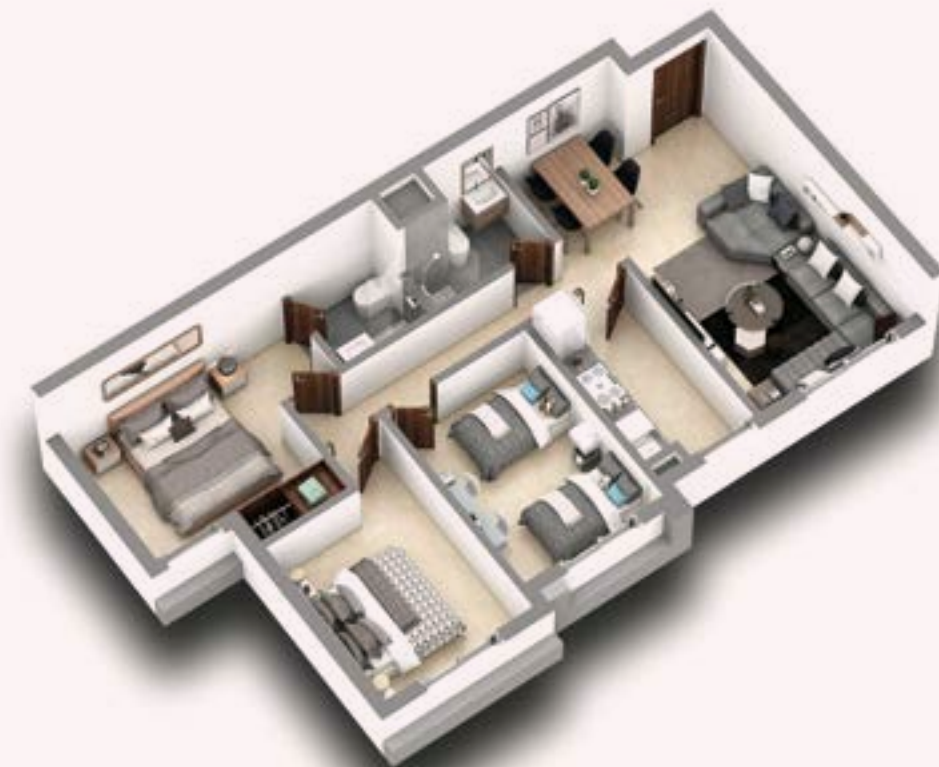
Plans, perspectives et surfaces indicatifs pouvant être soumis à des modifications